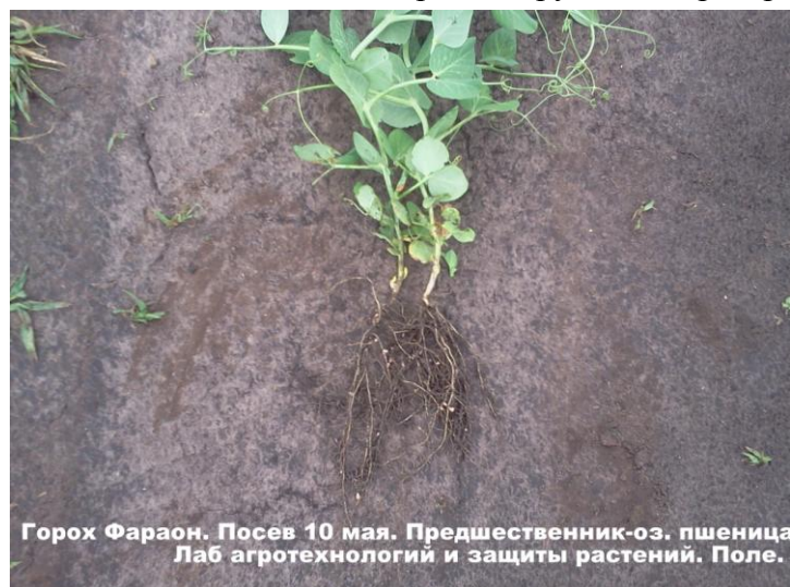
Рис. 2 Формирование клубеньков на корнях гороха сорта Фараон.

В 2013 г. проведено обследование посевов гороха в других лабораториях (рис 2, 3, 4).