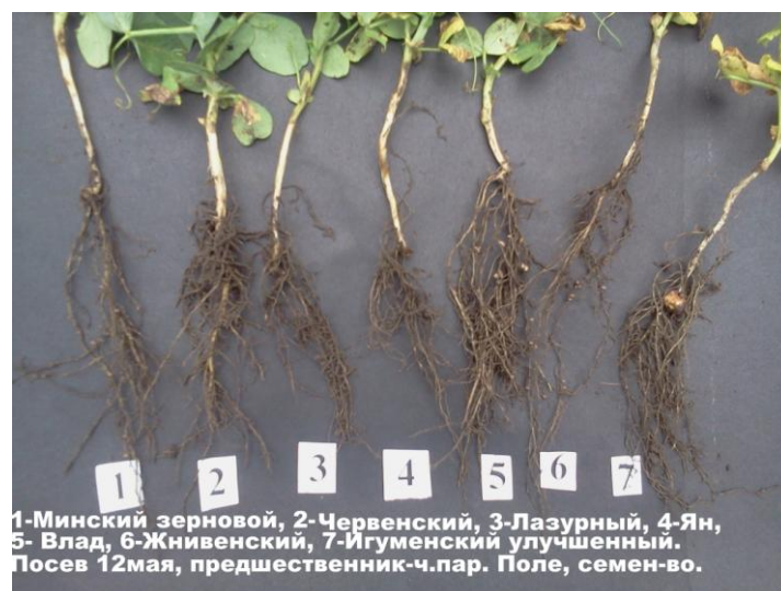
Рис. 4 Формирование клубеньков на корнях гороха белорусской селекции. Фаза бутонизации.

Таким образом, просматриваются, при прочих благоприятных условиях внешней среды, два фактора влияющих на формирование клубеньков: это предшественник и срок посева. В наших исследованиях лучшим предшественником оказалась озимая пшеница, но при менее благоприятном для роста и развития позднем сроке сева. Кстати сказать, в своей практике мы неоднократно наблюдали прекрасное образование клубеньков на корнях падалицы гороха после его уборки, что часто использовали для выделения чистой культуры клубеньковых бактерий. Таким образом, сам по себе срок посева не имеет никакого влияния на образование клубеньков. Всё дело в сфере