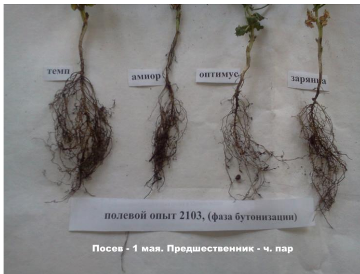
Рис. 1 Наличие клубеньков на корнях гороха разных сортов.

(торф, вермикулит). Таким образом, отсутствие клубеньков, а следовательно симбиотической азотфиксации, мы не смогли оценить ни действие препаратов клубеньковых бактерий, ни отзывчивость на них разных сортов гороха (рис.1).