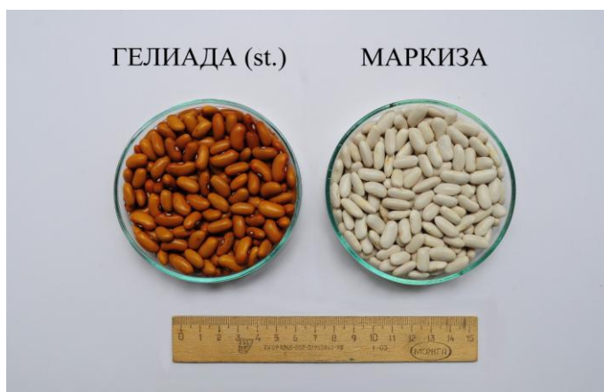
Рис. 3. Семена сортов Гелиада (st.) и Маркиза

Семена ровные, гладкие, блестящие вальковатой формы, масса 1000 семян – 350...430 грамм, окраска кожуры белая, семенной рубчик белый с однородным, желтым кольцом (рис. 3).