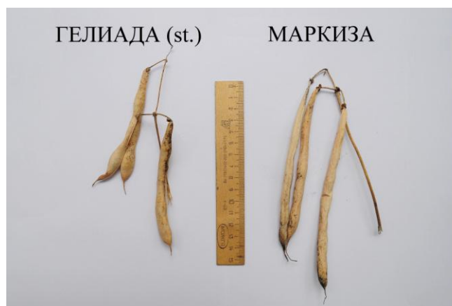
Рис. 2. Бобы сортов Гелиада (st.) и Маркиза

Боб лущильного типа грубо-волокнистой длиной 12...15 см с заостренной верхушкой. Среднее число бобов на растении – 16, максимальное 35 штук, хорошо выполнены, число семян в бобе – 4...7 (рис. 2).